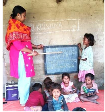
En hiver, la place est restreinte, mais l'enthousiasme demeure !