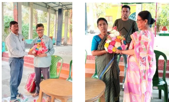
Chèque de deux ans de salaire (avance 50%) Un bouquet de fleurs offert par les travailleurs.