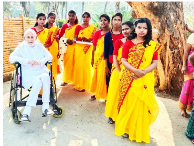
Le jaune est la couleur du jour...et le matin moi-même revêt cette tenue... mais pas en soirée !